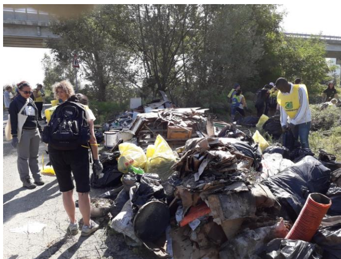
Alcuni momenti della raccolta dei rifiuti con Legambiente Parma