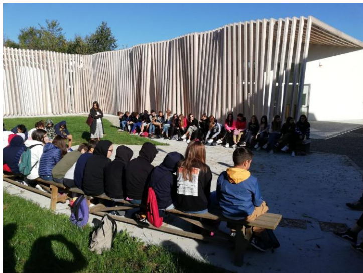
Studenti in visita al Podere Millepioppi di Salsomaggiore (PR)