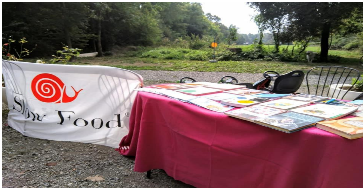
Alcuni momenti dell'evento ai Boschi di Carrega