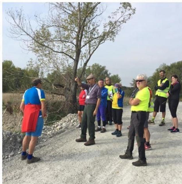
Alcuni momenti della visita ai Laghetti di Medesano

Purtroppo non è stato raggiunto il numero sufficiente d'iscritti per l'iniziativa “Gente d'Appennino: le radici del restare” che quindi è stata annullata.