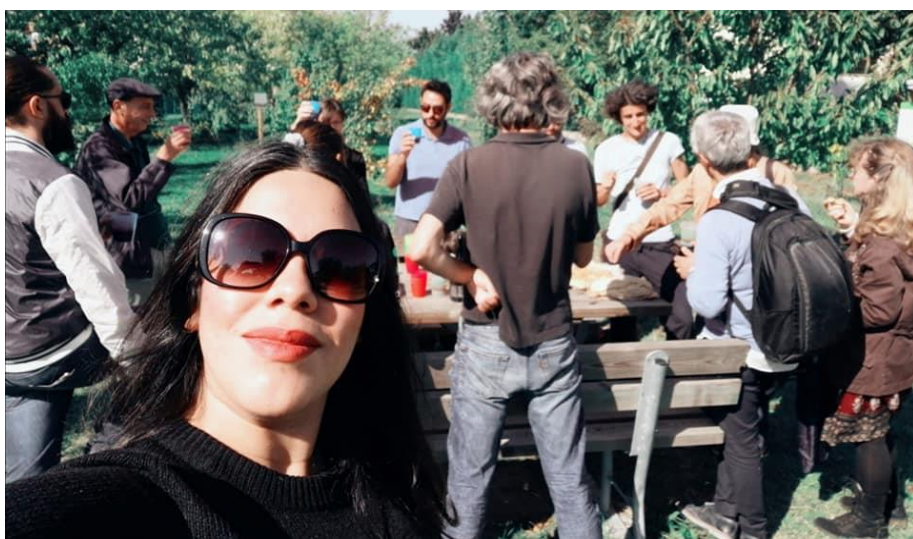
Alcuni momenti della visita alla Picasso Food Forest di Parma